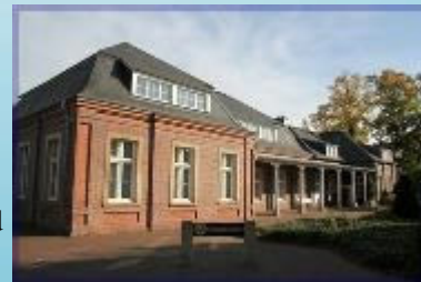
Bild 8: "Platz am Bürgerhaus" / Am Gorbach 4