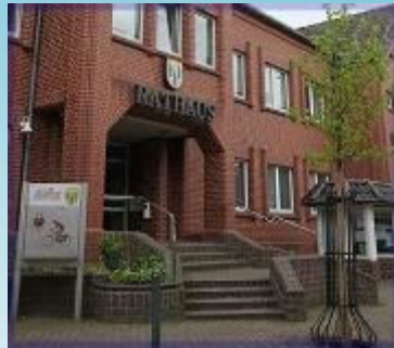
Bild 2: "Ludwig-Becker-Platz"