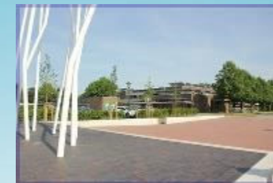
Bild 9: "Alte Rentei" / Schloßstraße 23